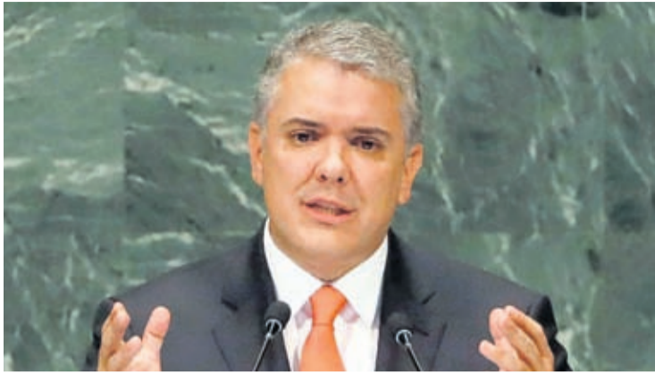
BOGOTA, Colombia (AP) — Autoridadnan Colombiano ta investigando un posibel plan, envolviendo Venezolanonan, pa asesina presidente Ivan Duque, segun un halto oficial a bisa diasabra anochi. Minister di exterior, Carlos

Holmes, a bisa cu e servicionan di inteligencia Colombiano ta bin scuchando rumornan tocante supuesto plannan pa asesina e conservador Duque. El a bisa cu e aresto, den dianan recien, di tres Venezolano den posesion di armanan a intensifica e preocupacion di e autoridadnan. “Cu inmenso preocupacion y e maximo condena, mi kier informa e comunidad internacional cu, en efecto, durante e ultimo lunanan, investigacionnan di inteligencia ta tumando luga tocante posibel atentadonan contra e bida di e presidente”,